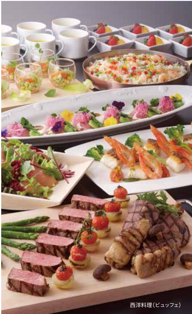
西洋料理(ビュッフェ)

■ 時間／9:00～21:00 時間内180分 ■ 人数／20名様より ■ 会場／宴会場