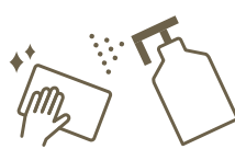
定期消毒の強化 Regular sanitisation

各フロアにおけるロビーや、レストラン、ショップ、化粧室に消毒液を設置しております。 We set sanitisers at lobby, restaurants, shops, and bathrooms at each floor.