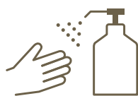
消毒液の設置 Setting sanitisers

各フロアにおけるロビーや、レストラン、ショップ、化粧室に消毒液を設置しております。 We set sanitisers at lobby, restaurants, shops, and bathrooms at each floor.