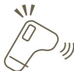
出勤時の体調、健康管理

Physical condition is checked at time of the attendance.