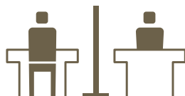
アクリル板の設置 Placement of acrylic boards

飛沫感染防止を目的とし、レストランにあクリル板などにより仕切りを設置しております。